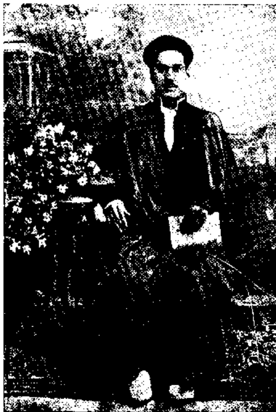
نویسنده کتاب در ۳۱ سالگی

مثلاً یکی از جُستارهایشان ۱ بدین عنوانست: «آیا مقدمه واجب واجبست؟». خودشان مثل زده چنین می گویند: «آقای به غلامش فرموده برو بالای بام. رفتن بالای بام واجبست و جای سخن نیست. ولی آیا نردبان گزاردن که مقدمه آنست نیز واجبست؟».