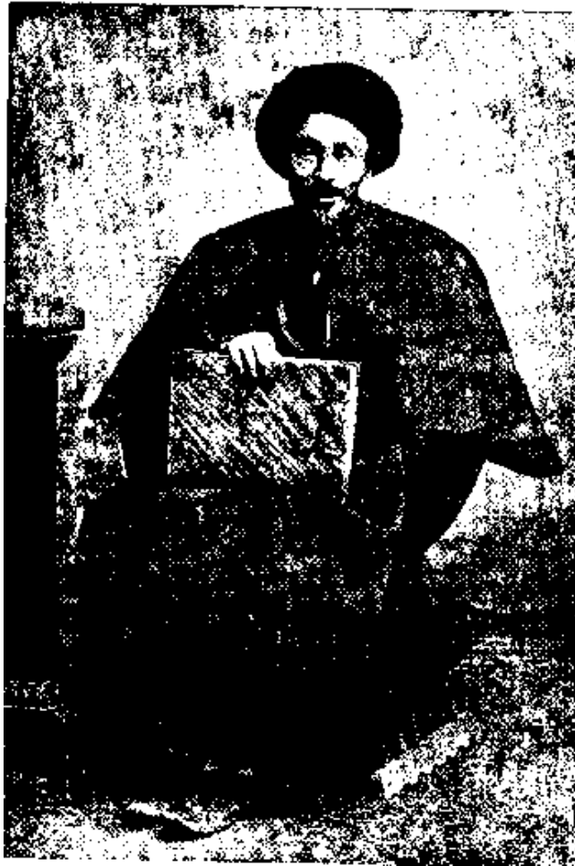
سید جمال الدین اسپهانی

پدرم اندامی باریک، بالایی میانه، ریش کوسج، رُخساره گندمی می داشت. از او پیکره نمانده ولی هر زمان چشمم به پیکره سید جمال الدین واعظ اسپهانی (واعظ مشروطه) افتد پدرم را به یاد آورم. در رخساره بسیار مانند هم میبوده اند. تنها چشم های پدرم درشت تر و دستاری که بسر میگذاشت کوچکتر می بود.