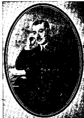
سید جلیل اردبیلی

پس از رفتن ایشان مکرم الملک نامی از اعیانزادگان تبریز «نایب الایاله» شد، و این مرد از دشمنان آزادی می‌بود و پی آزار آزادیخواهان می‌گشت. ولی در بیرون آدمکشی‌های خیابانی و نوبری و دیگر کارهای ایشانرا بهانه می‌گرفت. همچنان کارهای بد برخی از دموکراتها را به رخ ما می‌کشید.